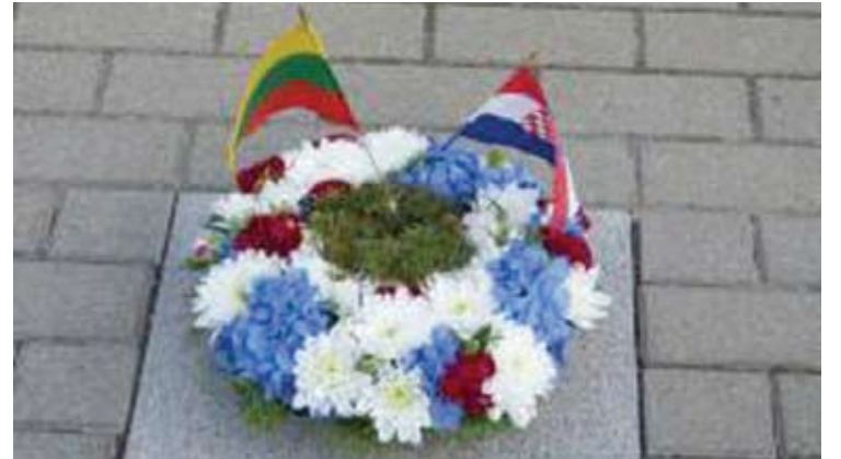
Tai dvyliktoji Kalbų alėjos plytelė, ant kurios iškaltas pasisveikinimas kroatų kalba.

Okuličiūtės dvarelyje šeštadienio vakarą pristatytas naujas žaidimas - „Pabėgimas iš paslapčių dvaro“. Vadovaujantis užuominomis ir sprendžiant užduotis reikėjo rasti kelią iš dvarelio.