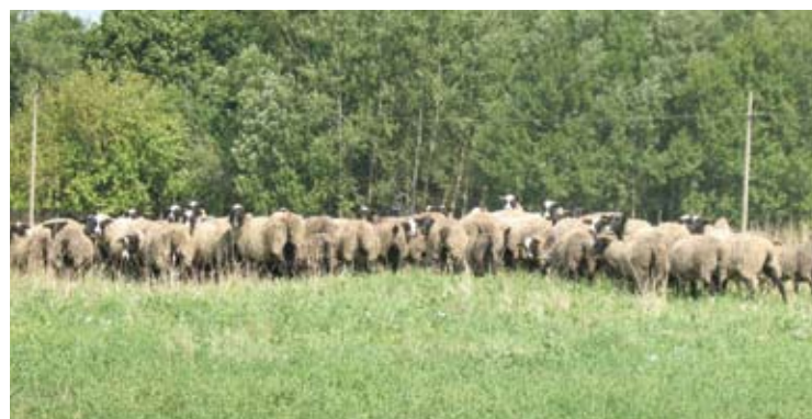
Vilkai intensyviai pjauti gyvulius pradėjo rugpjūčio mėnesį.

Šiemet fiksuoti 23 vilkų išpuoliai prieš Anykščių ūkininkų gyvulius. Plėšrūnai sudraskė 99 avis ir vieną telyčią. Dažniausiai po nakties sudraskytas avis ūkininkai randa pirmadienio rytais.