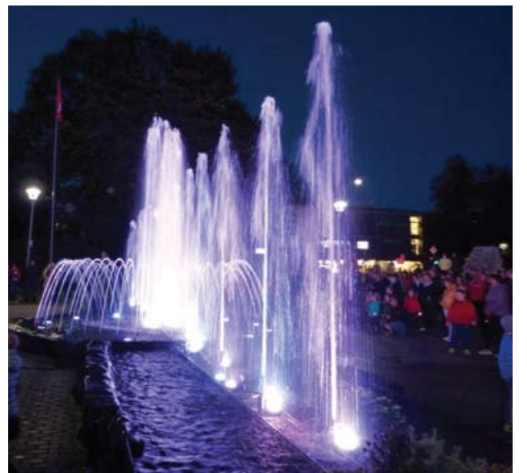
Šokantys fontanai kainavo 2 tūkstančius eurų.