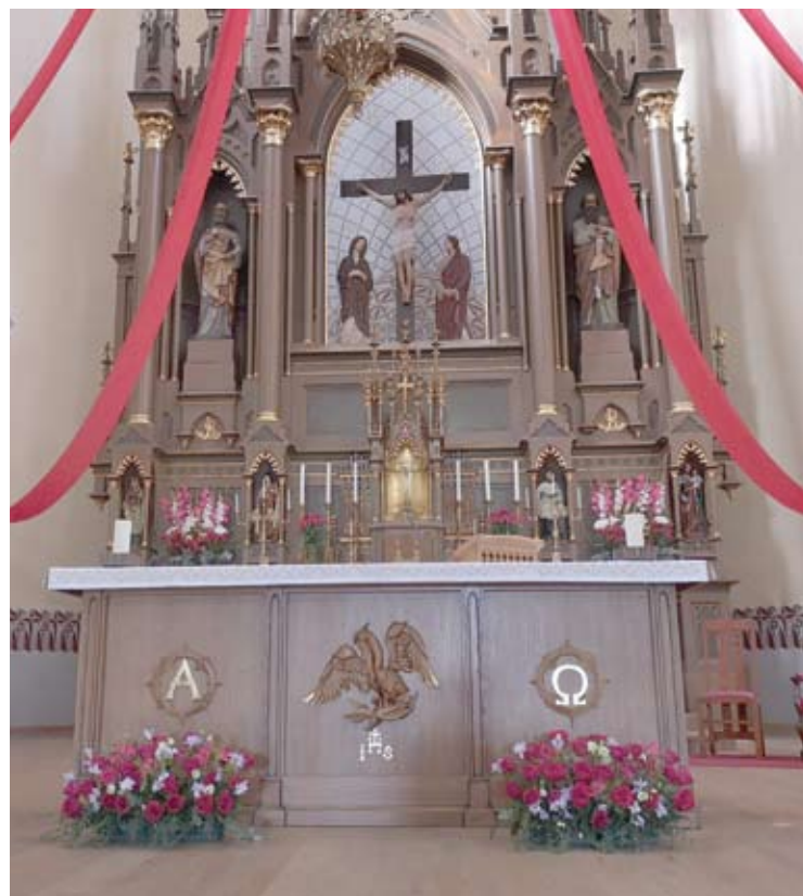
Naujasis Anykščių Šv.Mato bažnyčios altorius pirmiausia derintas prie bažnyčios mastelių.